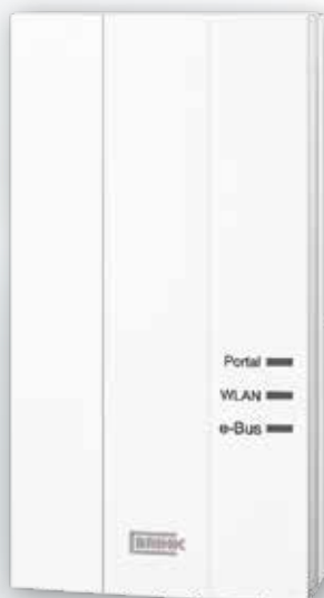
Brink Home Module

Brink Home główna składa się z modułu głównego Brink Home i aplikacji, które są połączone z rekuperatorem Renovent, może on być także wyposażony w moduł sterowania czasowego Air Control. Urządzenia z serii Brink Renovent są wtedy dostępne za pośrednictwem routera (W) LAN lub serwera Brink Portal. Aplikacja Brink Home App dla smartfona i tabletu jest dostępna dla Androida i iOS.